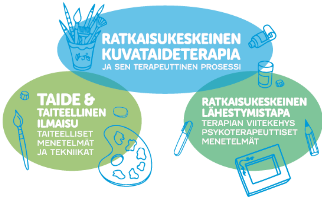
Ratkaisukeskeisen kuvataideterapian lähtökohdat

Aivotutkimukset vahvistavat ratkaisukeskeisyyden toimivuutta: Ongelmiin ja ei-toivottuun käyttäytymiseen fokuointi lisää ongelmia. Jos kiinnitämme huomiomme mahdollisuuksiin, ne kasvavat. Jos kiinnität huomiosi ongelmiin, ne paisuvat. Myönteisillä tunteilla on vahvistava ja rakentava vaikutus. Se, mihin kiinnitetään huomio, kasvaa ja voimistuu!